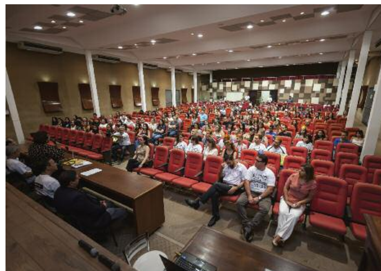
Boas-vindas aos Pais/Responsáveis e Calouros pelos Dirigentes da USP e do Campus de Bauru