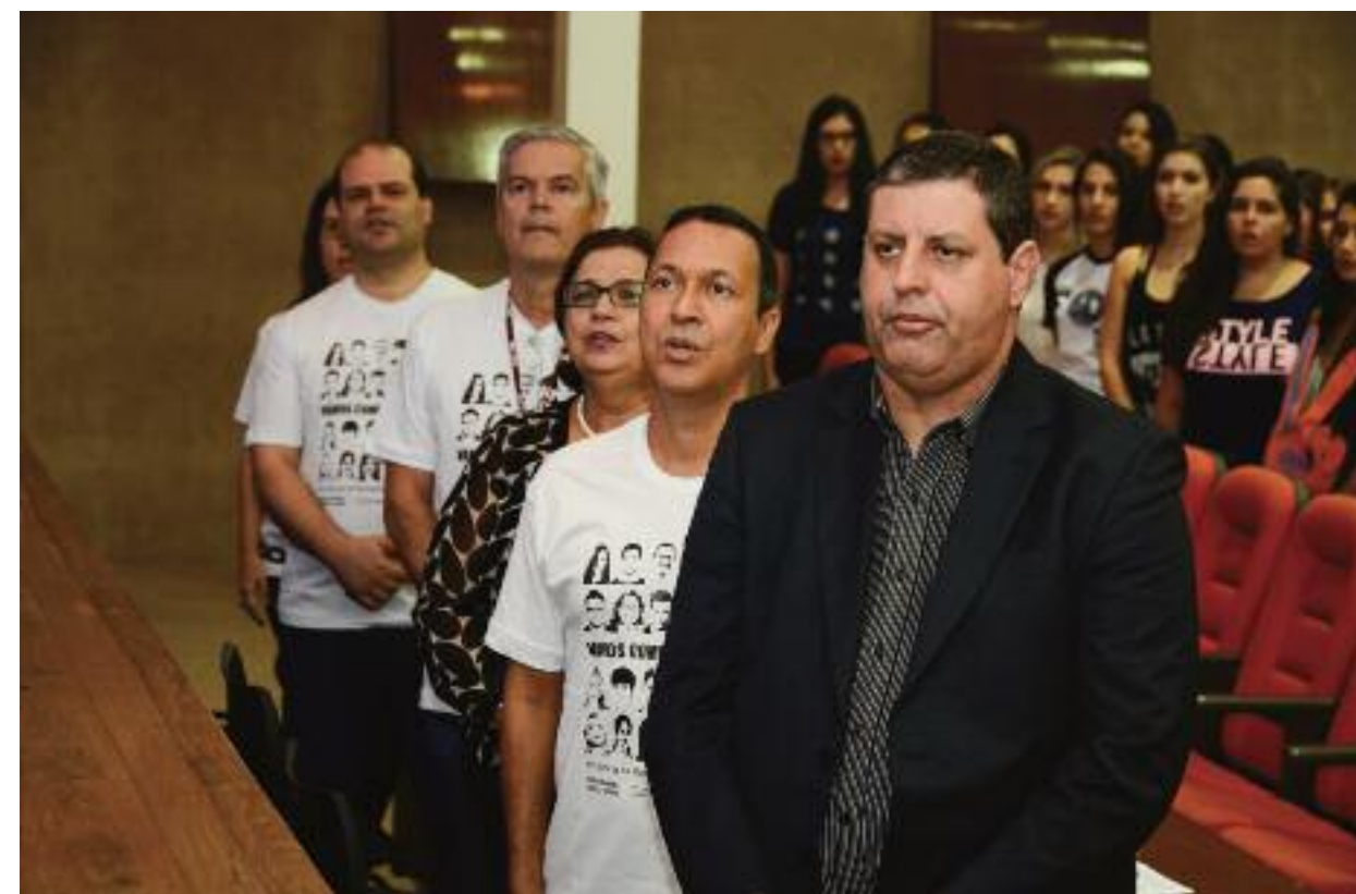
Execução do Hino Nacional