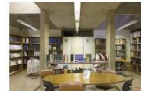
Seção de Referência Especializada em Malformações Congênitas Craniofaciais (SRE)