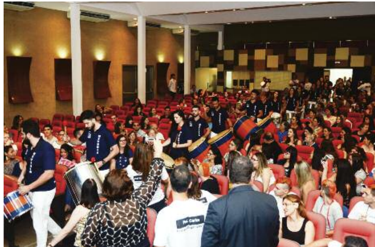
Apresentação da Bateria da FOB