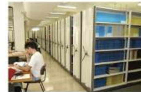
Serviço de Biblioteca e Documentação (SBD)

No Campus USP Bauru, o Serviço de Biblioteca e Documentação oferece serviços na FOB e no HRAC.